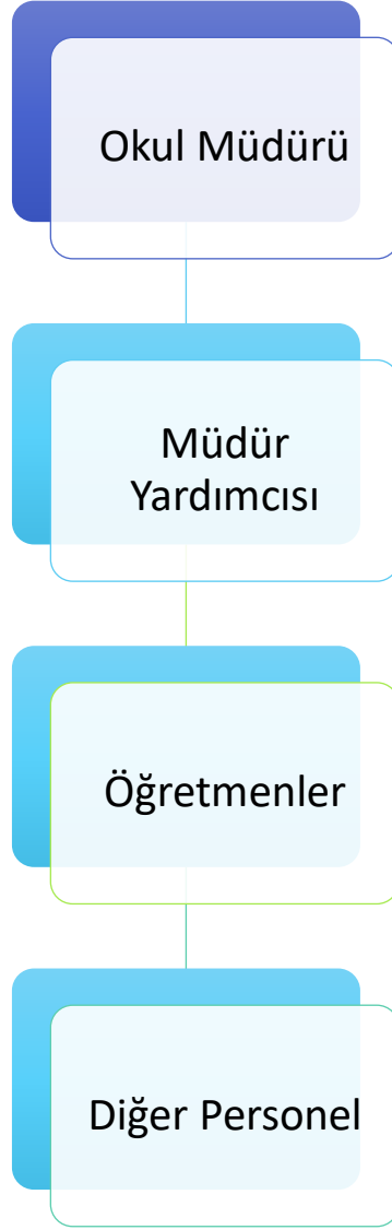
Grafik 2: Yassihöyük İlkokulu Teşkilat Şeması